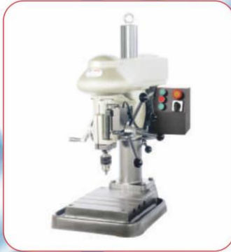
Masaüstü Delik / Kılavuz Matkabı ( Bench Drilling and Tapping Machine )