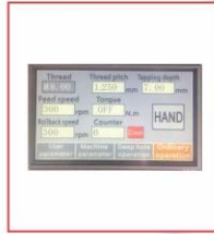
PLC-HD ekran (PLC-HD screen)