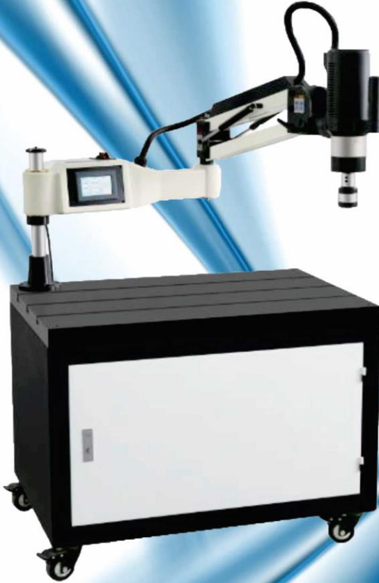
Model SD36-U (Max M36 Universal)

Eski nesil pnömomatik veya hidrolik kılavuz çekme makinalarına veda edin. Yeni nesil elektrikli servo kılavuz çekme makinaları ile bakım yok, kolay kullanım ve uygun fiyatlar.