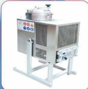
Solvent / Tiner Arıtma Makinası ( Solvent Recycling Machine )