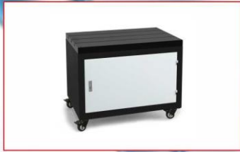
Tekerlekli, T kanallı sehpa (Workbench with T slots and wheels)