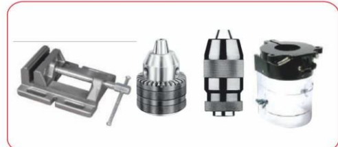
Mengene, Mandren, Siperlik (Vice, Chuck, Chuck Guard)

SENEL ENDÜSTRİ MAKİNA VE METAL SAN. TİC. A.Ş.