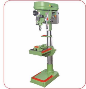
Sütunlu Matkap Tezgahı - Siviçli ( Floor Drilling / Tapping Machine )