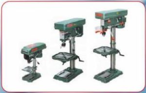
Ekonomik Matkaplar (Eco Series)