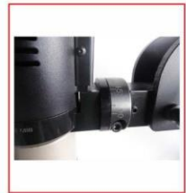
Açı ayarı (Angle positioning)