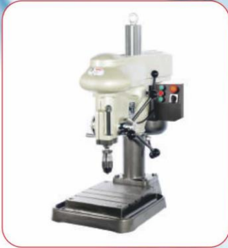
Masaüstü Delik Delme Matkabı ( Bench Drilling Machine )