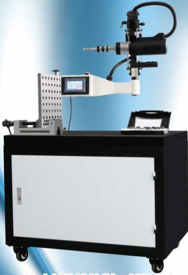
Model SD16-U (Max M16 Universal)