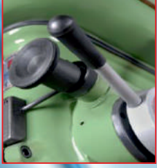
Metrik indirme sistemi (precision drilling)