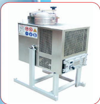
Solvent/Tiner Arıtma Makinası (Solvent Recycling Machine)