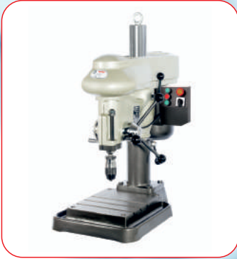
Masaüstü Delik Delme Matkabi (Bench Drilling Machine)