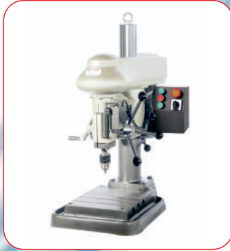
Masaüstü Delik/Klavuz Matkabi (Bench Drilling and Tapping Machine)