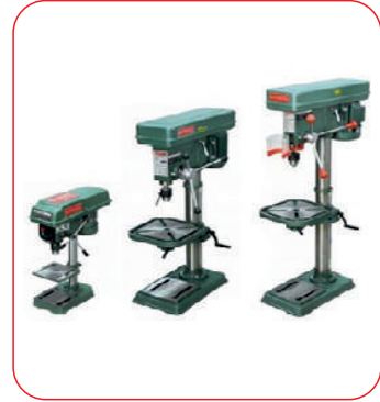
Ekonomik Matkaplar (Eco Series)