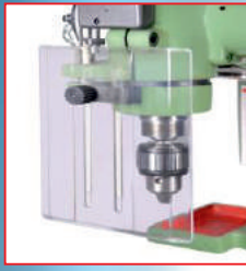
Seffaf siperlik (Transparent drill guard)