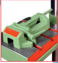
Matkap mengenesi üzerinde (Drill vice)