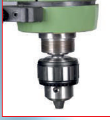
Mors-mandren üzerinde (Morse taper and chuck)