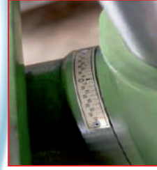
360° döner tabla (360° spinning table)