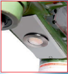
12V led aydınlatma (12V led illumination)