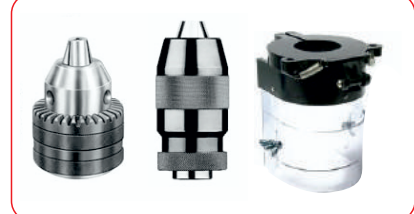
Mandren & Siperlik (Drill Chucks & Guards)