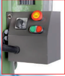
Acil stoplu pano (Control box)