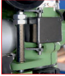
Siviç tertibatı (Switch equipment)