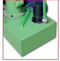
Su soğutma (opsiyon) (Cooling system (option))