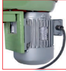
Emsallerinden güçlü (1,5kw) (The strongest among similars)